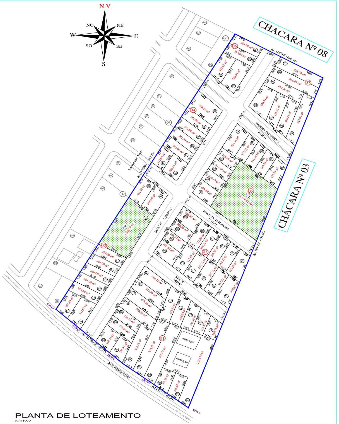
PLANTA DE LOTEAMENTO